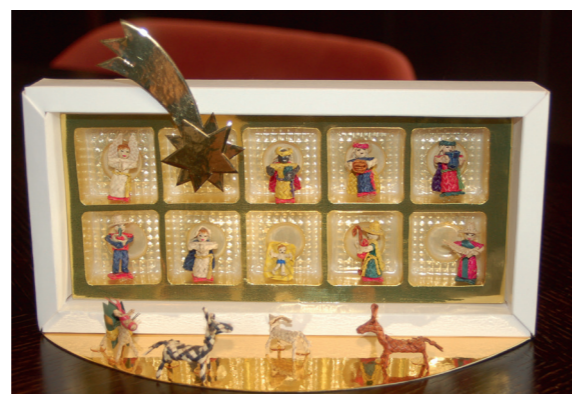
Mexikanische Strohkippe präsentiert in einer Pralinschachtel