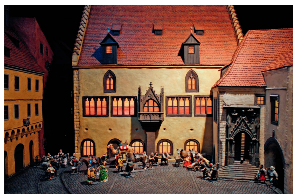
„Ankunft der Könige“, Krippe von Matthias Prüll

www.instagram.com/regensburger_krippenweg